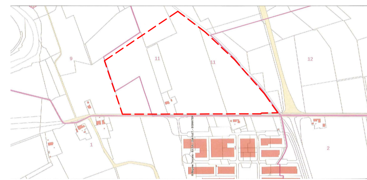
INQUADRAMENTO ZONA INTERVENTO Scala 1:10000