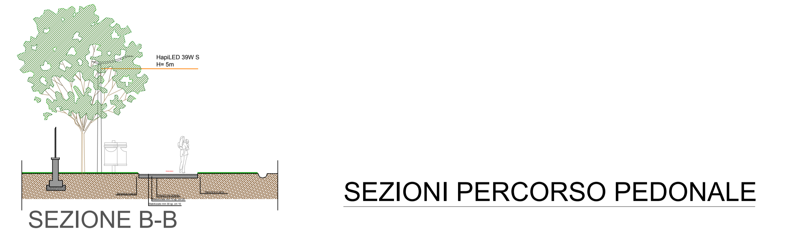
SEZIONI PERCORSO PEDONALE